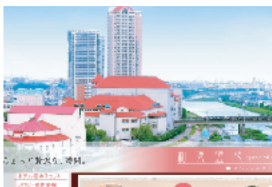
公式サイトからご予約